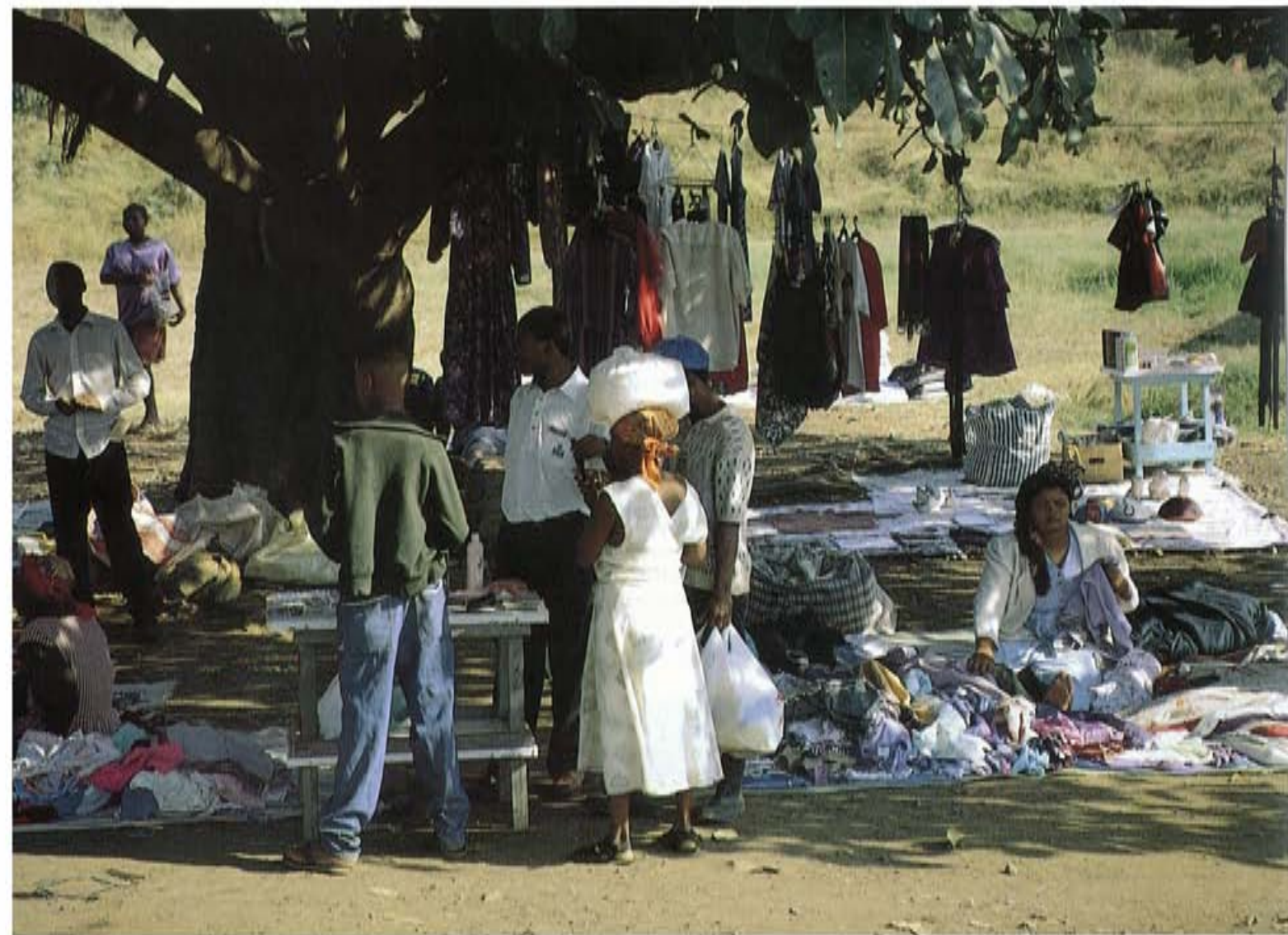
LOKALE MARKT BIJ BIG BEND, SWAZILAND

ges' veel te weten over de zwarte stammen zoals de Zulu's en de Ndbele die nog steeds volgens eeuwenoude familie tradities leven. Die manier van leven staat haaks op het blanke kapitalisme waarbij het leven niet draait om tradities maar om geld. Veel zwarte jongeren maken zich los uit hun familie structuur om het kapitalisme na te jagen. Want zo'n dikke auto en mobiele telefoon: dat willen zij ook wel. Maar het is niet alleen blank versus zwart. Ook de zwarte stammen verschillen onderling regelmatig van mening. We spreken onderweg bange, racistische blanken, haatdragende, egoïstische zwarten en alles wat daartussenin zit. Voor velen zijn de maatschappelijke spanningen dé reden om niet meteen te emigreren naar dit land dat qua natuur en klimaat ideaal lijkt. Reizend wordt je onvermijdelijk geconfronteerd met een stukje Nederlandse geschiedenis. Al is het maar door het Afrikaans, een grappig verbasterd Nederlands, dat je overal om je heen hoort spreken. Door blank én zwart.