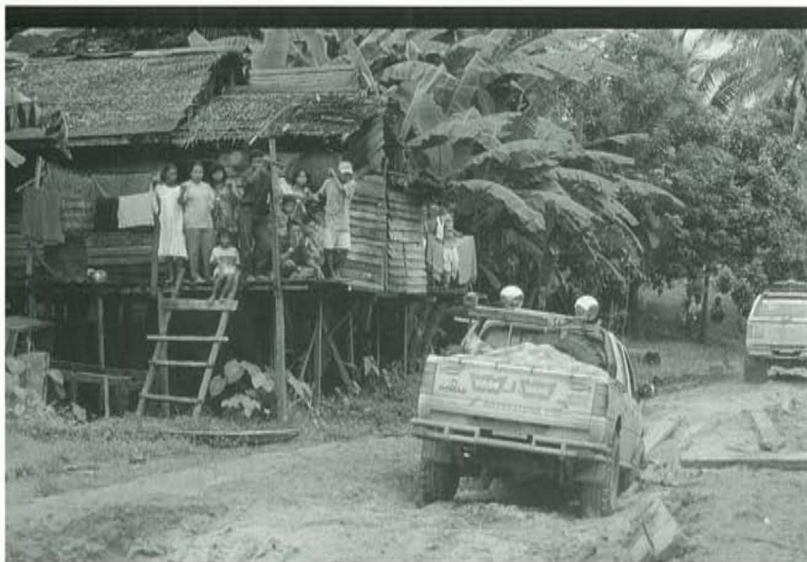
De bevolking kijkt nieuwsgierig toe hoe het konvooi zich een weg baant over de slechte wegen.