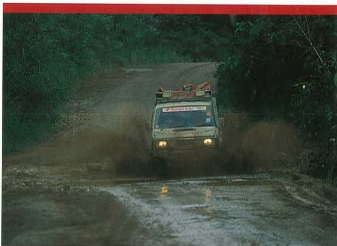
De regen doet de kuilen in de weg in enorme modderpoelen veranderen.