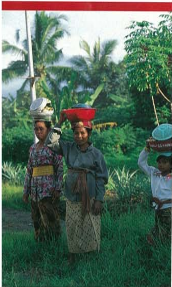
Met cadeau's op hun hoofden zijn deze inwoners op weg naar een verjaardag in het volgende dorp.