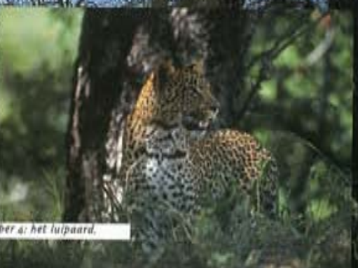
Number 4: het luipaard.