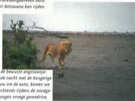
Na de bewuste angstaanjagende nacht met de hongerige leeuw om de auto, komen we 's ochtends tijdens de noodgedwongen vroege gamedrive, de beste 'man' tegen. Hij is degene die ons de hele nacht heeft wakker gehouden.