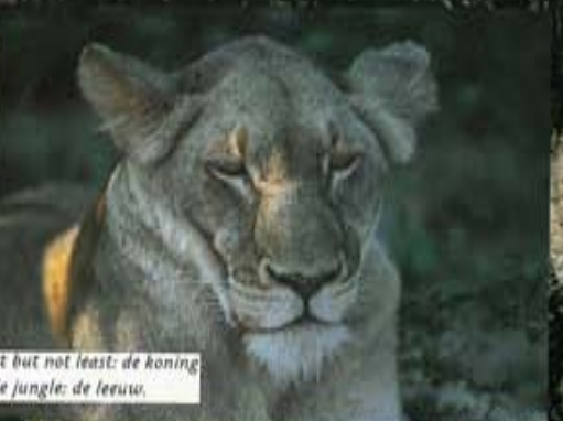
In last but not least: de koning van de jungle: de leeuw.

Het echte ruige Afrika, in het Moremi National Park.