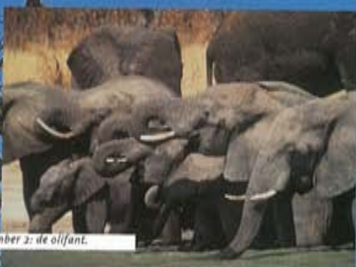
Number 2: de olifant.