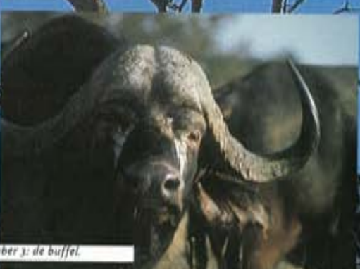
Number 3: de buffel.