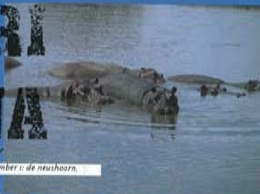
Number 1: de neushoorn.