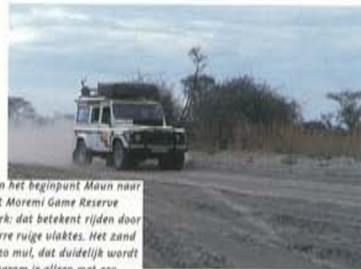
Van het beginpunt Maun naar het Moremi Game Reserve Park; dat betekent rijden door dorre ruige vlaktes. Het zand is zo mul, dat duidelijk wordt waarom je alleen met een vierwielaangedreven auto door Botswana kan rijden.