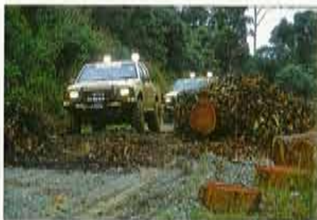
Sporen van de massale houtkap