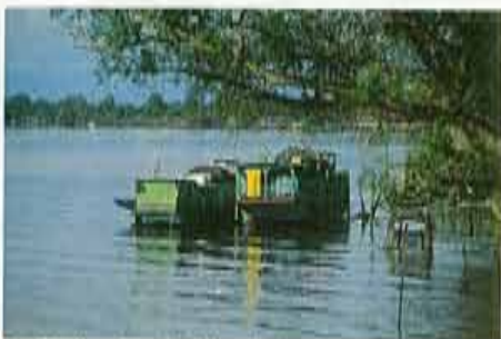
Op het eiland van de duizend rivieren wonen veel mensen op het water