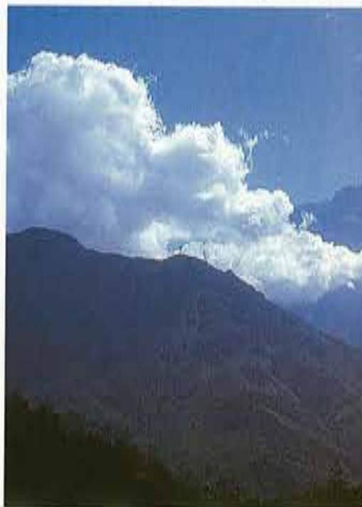
De Mount Kinabalu is de hoogste berg van Borneo

We rijden door enorme kale stukken. En je zal het altijd zien. Als het mis gaat, gaat het ook goed mis. Het gaat regenen. De hemel breekt open en de regen komt urenlang met bakken naar beneden. Drie dagen regent het een paar uur per dag. We scheppen, duwen, trekken en lieren de auto's door de zuigende modder. Het is lachwekkend om bij de kleine dorpjes motorrijders te zien worstelen met hun motoren waarvan de wielen diep zijn weggezakt in de oranje klei. Behalve de auto's van de expeditie helpen we ook een aantal in de modder weggezakte bussen en vrachtwagens weer op weg. We slapen in tentjes in de