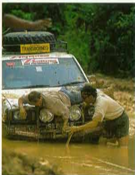
Het was niet altijd even makkelijk