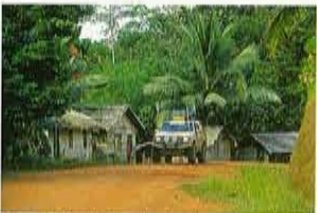
Eén van de twaalf Isuzu Invaders in een dorpje in Zuid-Kalimantan