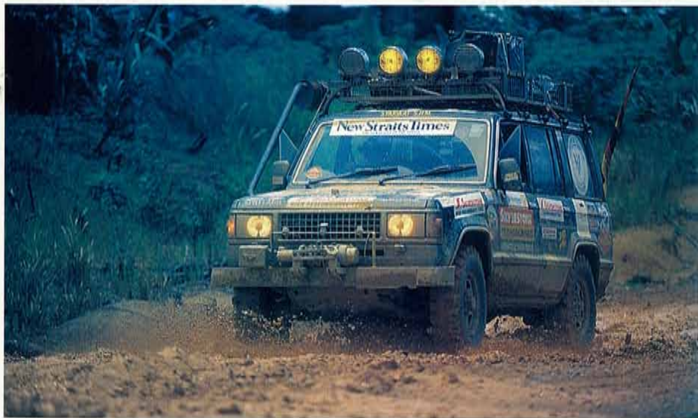
De auto uit Sarawak, die als eerste het rondje Borneo maakte. De uitlaat bovenlangs vergroot de grondspeling.

gehad. Ik begin een beetje te twifelen aan de wijsheid van het besluit om de uitnodiging voor het meemaken van deze tocht te accepteren. Aan de andere kant hebben de verhalen over dit mystieke eiland zo'n enorme aantrekkingskracht dat ik wel heel nieuwsgierig word. Het unieke van deze expeditie is de tot op heden nog nooit vertoonde samenwerking tussen de regeringen van Maleisië, Indonesië en Brunei. Hoewel in de jaren veertig de laatste kop gesneld is,