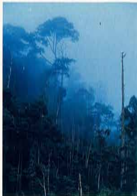
De jungle in de ochtendnevel

Hoewel bijna alle plekken op aarde reeds zijn doorkruist blijven mensen op zoek naar het onbekende. Naar de laatste grens. De Trans Borneo Jungle Periplus is een expeditie die voor het eerst in de geschiedenis het op twee na grootste eiland ter wereld rondrijdt. Het is een lokaal georganiseerd internationaal evenement dat, zoals na afloop geconcludeerd kan worden, grondig afrekent met de mythe van Borneo als een ondoordringbaar eiland vol wilden.