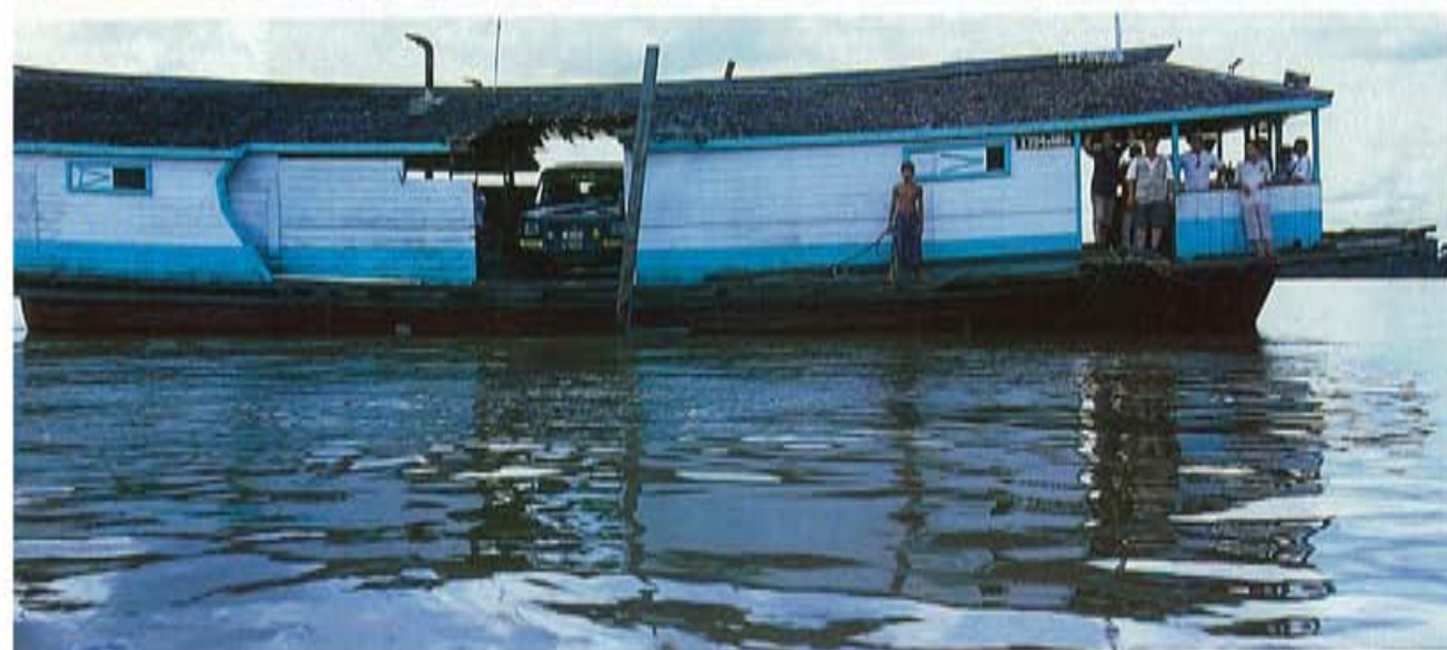
Tegen betaling zaagt de eigenaar van een woonboot zijn huus in tweeën, zodat hij alle auto's naar de overkant van de rivier kan brengen.