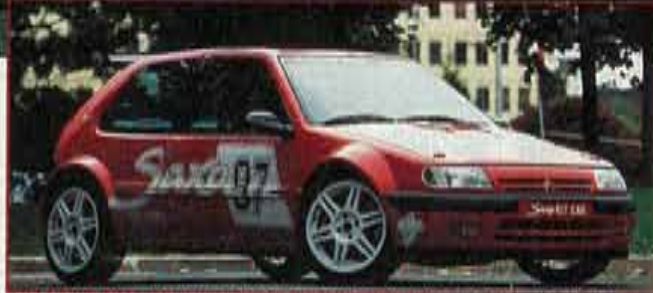
Een kitcar is in dit geval géén nagemaakte sportwagen, maar een echte Citroën - en wát voor een!