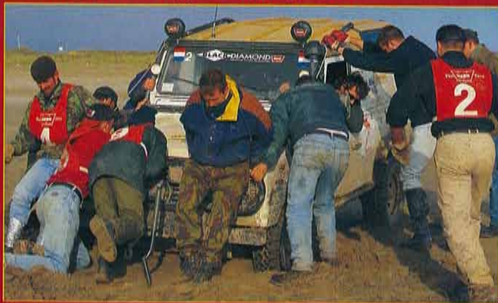
El trabajo en equipo es imprescindible para conseguir una buena puntuación.

más complicados estaba situado al final de una subida fortísima. Para el equipo holandés tuvo un alto costo: el Defender 90 TDI se quedó sin transmisión delantera. Por la noche, el granjero les ofreció los establos para llevar a cabo la reparación, a cubierto del alocado viento que sopla en las noches galosas. Tras el primer combate, los equipos aprovechaban para intercambiar piezas de recambio y así poder seguir en pie al día siguiente.