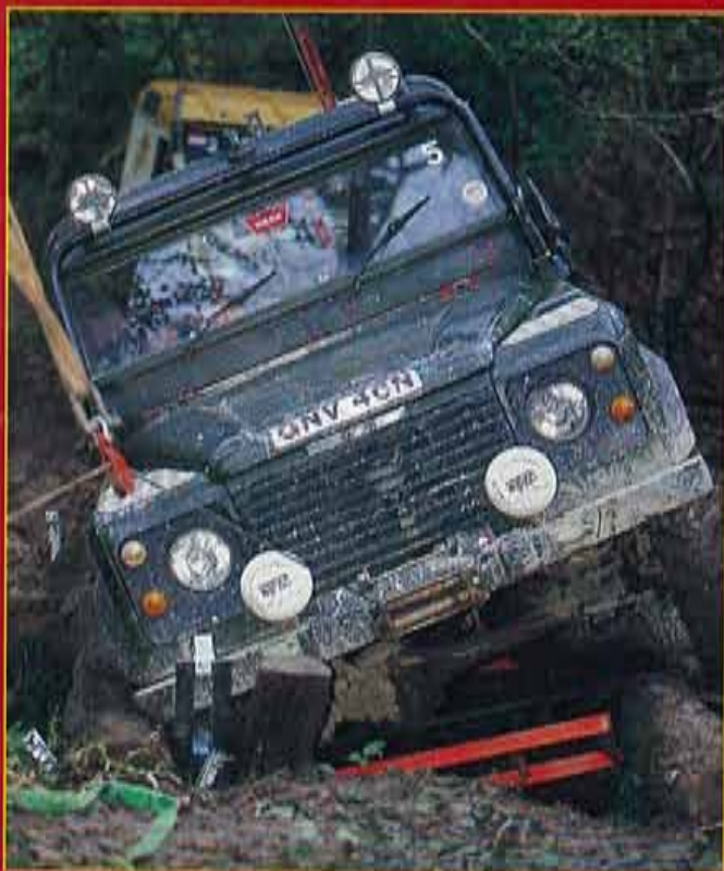
Con planchas y troncos los participantes se los ingeniarán para formar un puente.