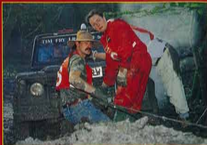
El winch, como en todo evento patrocinado por Warn, es el elemento base de trabajo.

los participantes se aseguraba de que sus coches quedaran bien cubiertos de arena. Tan pronto como se daba la salida, los vehículos enterrados debían ser rescatados con su propio winch, buscando el punto de anclaje en el propio suelo. Toda esta operación finalizaba con una espectacular carrera humana por llegar a la meta. Esta prueba fue el broche de oro del evento. Algunos participantes estaban tan excitados que condujeron su TT hasta el mismísimo océano. Los