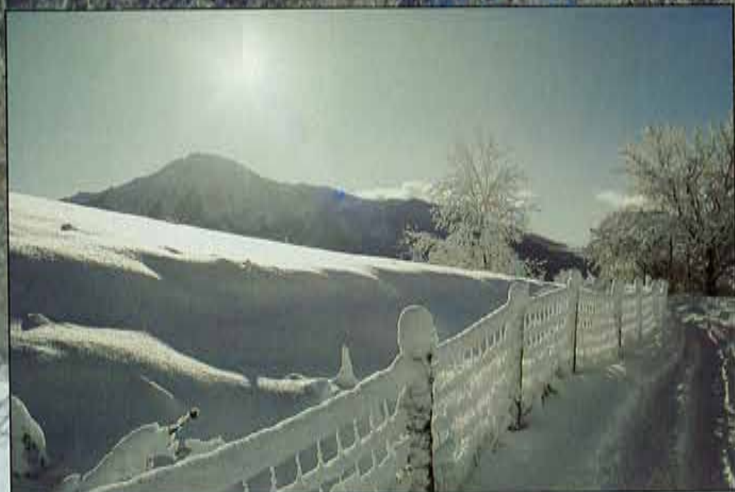
La Croisiere es una travesía de condiciones y paisaje espectacular.

Conducir a más de 1.600 metros de altitud, sobre las nubes, escuchando el crepitar de los neumáticos sobre la nieve, es una sensación absolutamente placentera. Esto no es una competición, ni mucho menos, pero tampoco es una simple travesía para novatos que se ven atraídos por la idea de rodar unos días entre estas montañas idílicas. Casi siempre hay un par o tres de par-