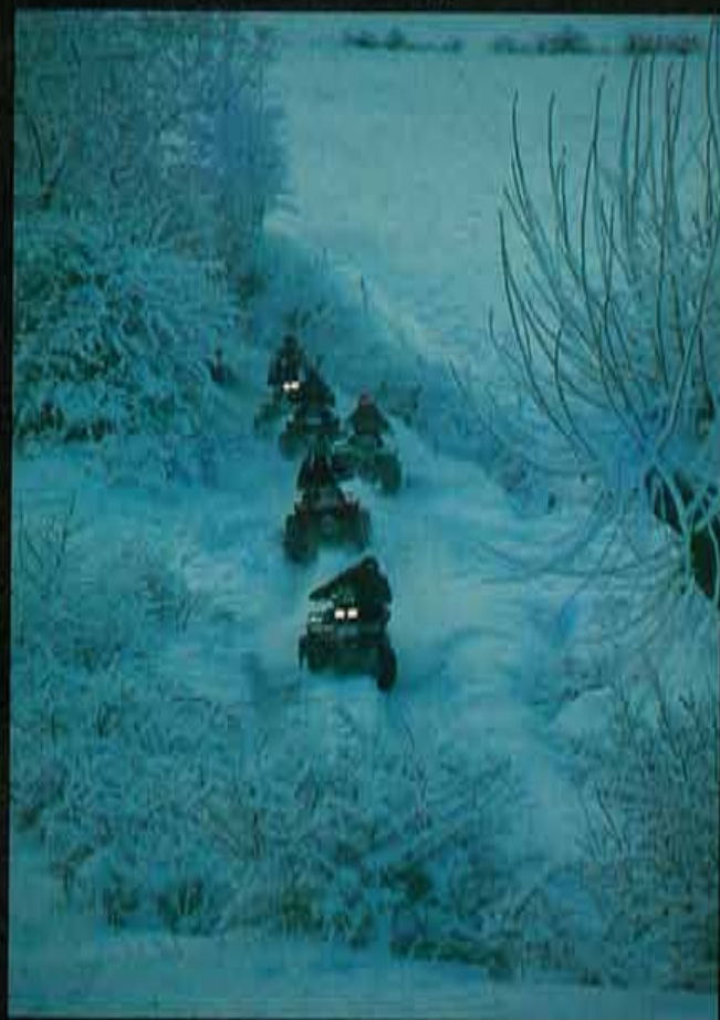
Mención especial a los cinco participantes discapacitados físicamente que completaron la Croisière Blanche en quad.

se apodera de nosotros en algunos pasos. Para algunos la noche ha sido demasiado corta. Los ingleses se las han compuesto para acostarse a las doce de la noche y acudir puntualmente a la salida de la pista negra, a las 7,00 de la mañana. Hoy me subo con ellos. El grupo anglosajón forma un nutrido convoy de siete vehículos. En general, todos piensan que el evento no es difícil y que, además, ofrece la posibilidad