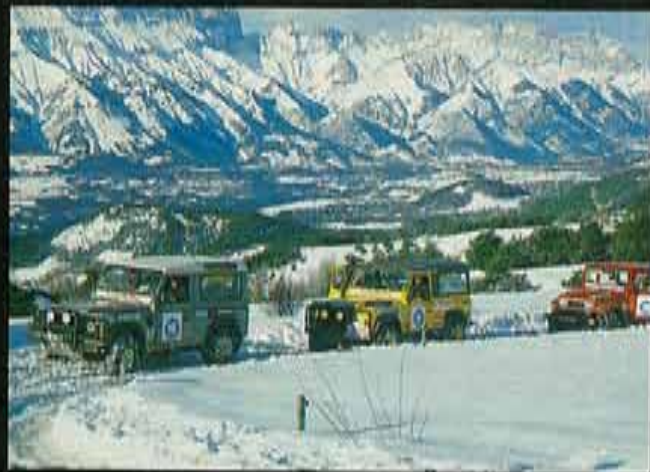
El valle de Champsaur, y las pequeñas facilidades hoteleras de los Altos Alpes, como las estaciones de esquí, son los reclamos más importantes de este lugar.