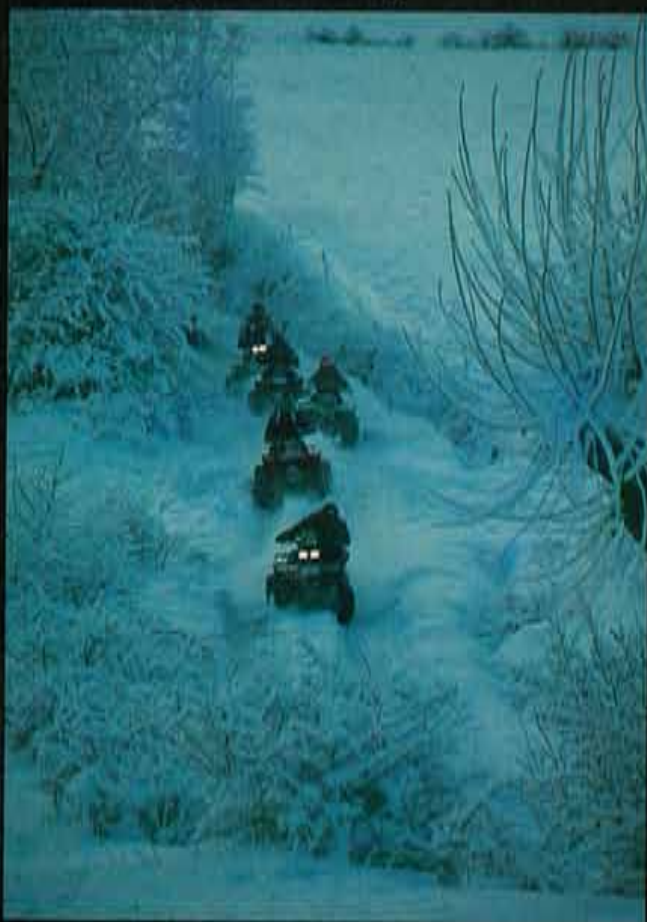
Mención especial a los cinco participantes discapacitados físicamente que completaron la Croisière Blanche en quad.

se apodera de nosotros en algunos pasos. Para algunos la noche ha sido demasiado corta. Los ingleses se las han compuesto para acostarse a las doce de la noche y acudir puntualmente a la salida de la pista negra, a las 7,00 de la mañana. Hoy me subo con ellos. El grupo anglosajón forma un nutrido convoy de siete vehículos. En general, todos piensan que el evento no es difícil y que, además, ofrece la posibilidad