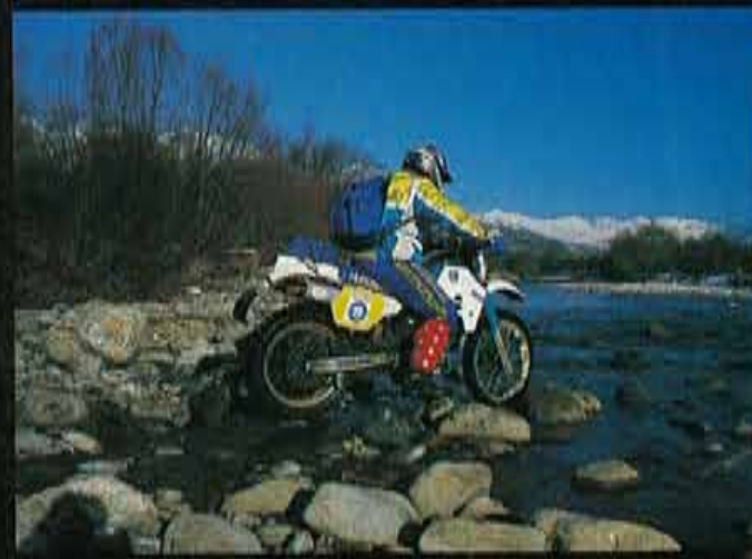
La participación está abierta a todo tipo de vehículos: coches, motos y quads.

ciudad más grande del valle -donde el fin de semana siguiente daba comienzo el rally de Montecarlo, cuyo podio utilizamos para presentarnos ante la sociedad de la ciudad-. La especial de noche se presenta de lo más movidita, y la gente local nos invita a queso y vino tinto para apaciguar el pequeño sentimiento de pánico que