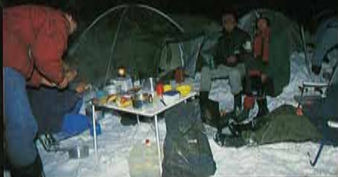
Una opción para masocas: dormir en tiendas de campaña.

El segundo día se inicia y acaba de madrugada. He escogido la pista roja. El recorrido que comienza en el Pont de Fosses es el más largo, pero no es el más difícil, lo que te permite dejar que los más ansiosos vayan abriendo la pista y quedarte completamente sola, rodeada de estas impresionantes montañas, disfrutando de la inti-