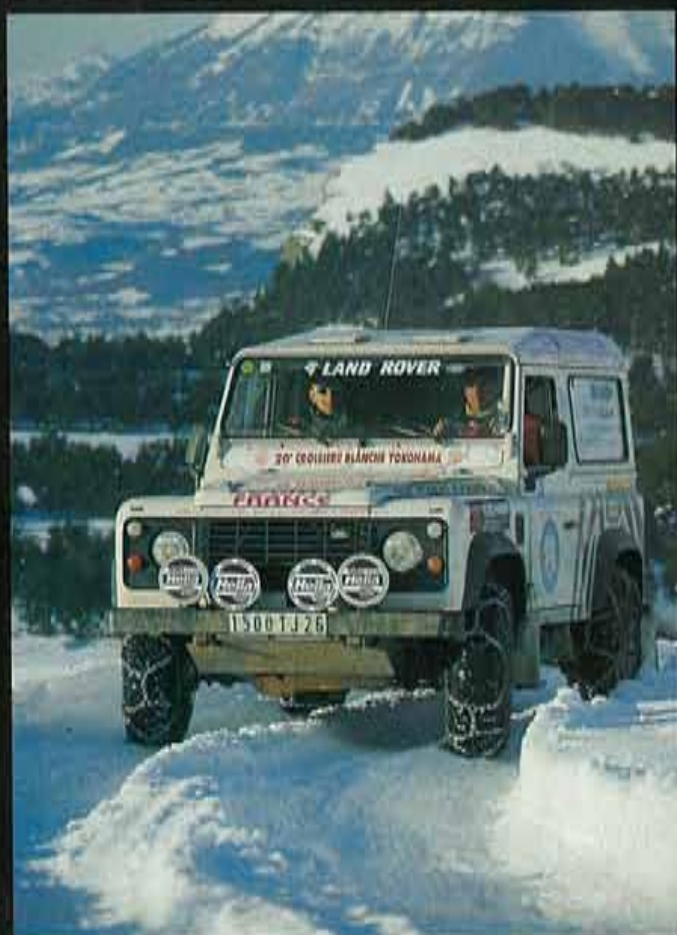
Las cadenas: equipamiento imprescindible.

los de la organización. Aún es de noche cuando salen los primeros vehículos, sobre las siete a.m. Hoy he decidido embarcarme en el grupo más heavy, los únicos 15 coches que no elegirán esta noche la fórmula del pequeño hotelito sur les Alpes , sino la acampada dura y pura. Nuestro grupo toma la "pista azul", la de más altitud: 1.800 m. Tras diez minutos de paz matutina, llega el momento de encarar un angosto valle rodeado de paredes. La nieve fresca ha cubierto la pista por completo: las cadenas se imponen, y los primeros vehículos se quedan estancados. Comienza el ejercicio matutino: palear, tirar de winch y empujar coches, algunos de más de dos toneladas de peso, como es el caso de un Toyota HDJ 80 que nos da algo más que trabajo. Antes de que el sol corone las montañas que nos rodean, ni que decir tiene que el hecho de salir del vehículo para trabajar en equipo no está en la lista de los 40 principales. El convoy avanza con lentitud. La quietud del valle se rompe con tanto ajetreo, esto es