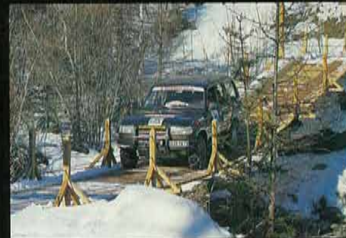
Este puente ha sido construido especialmente para la travesía.