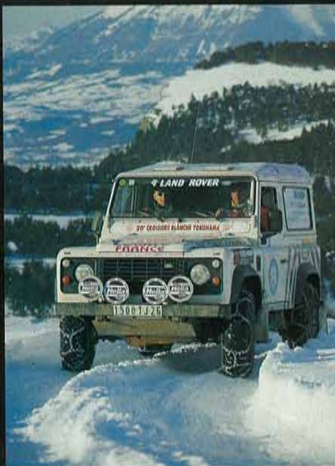
Las cadenas: equipamiento imprescindible.

los de la organización. Aún es de noche cuando salen los primeros vehículos, sobre las siete a.m. Hoy he decidido embarcarme en el grupo más heavy, los únicos 15 coches que no elegirán esta noche la fórmula del pequeño hotelito sur les Alpes , sino la acampada dura y pura. Nuestro grupo toma la "pista azul", la de más altitud: 1.800 m. Tras diez minutos de paz matutina, llega el momento de encarar un angosto valle rodeado de paredes. La nieve fresca ha cubierto la pista por completo: las cadenas se imponen, y los primeros vehículos se quedan estancados. Comienza el ejercicio matutino: palear, tirar de winch y empujar coches, algunos de más de dos toneladas de peso, como es el caso de un Toyota HDJ 80 que nos da algo más que trabajo. Antes de que el sol corone las montañas que nos rodean, ni que decir tiene que el hecho de salir del vehículo para trabajar en equipo no está en la lista de los 40 principales. El convoy avanza con lentitud. La quietud del valle se rompe con tanto ajetreo, esto es