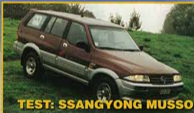
TEST: SSANGYONG MUSSO