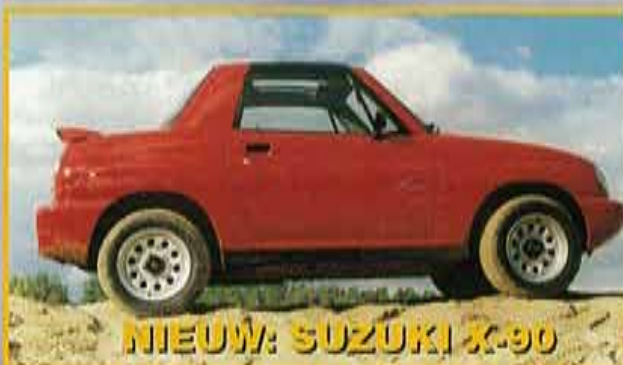
NIEUW: SUZUKI X-90