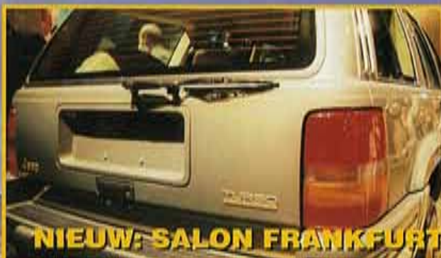
NIEUW: SALON FRANKFURT